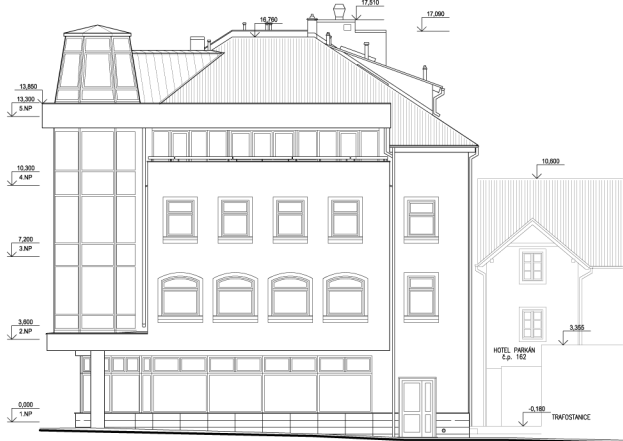
POHLED JIŽNÍ - STAV DLE VYDANÉHO STAVEBNÍHO POVOLENÍ